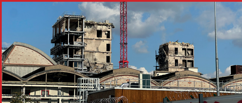
photo personnelle du 29 septembre prise depuis le parking de la SNCF

Quelle sont les conséquences ? mise en pause du chantier du quartier des Messageries dû à un périmètre de sécurité