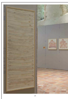
Élisabeth Lebovici La possibilité d'une — ou deux, ou trois, ou mille — elle