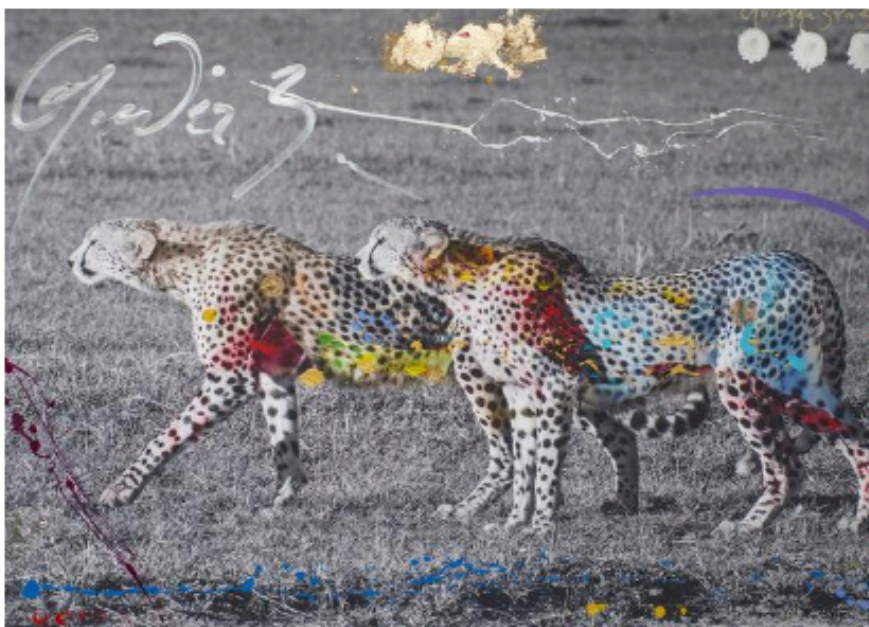
Art Photo Expo dans les jardin de l'Hôtel Plaza Athénée. © ARNO ELIAS

Comprendre la nature et l'environnement par le prisme de l'art. Voici la mission de cette nouvelle exposition, proposée dans le jardin de l'Hôtel Plaza Athénée avec Art Photo Expo. Quatorze artistes exposent leurs œuvres afin de vous faire reconnecter avec vos sens premiers.