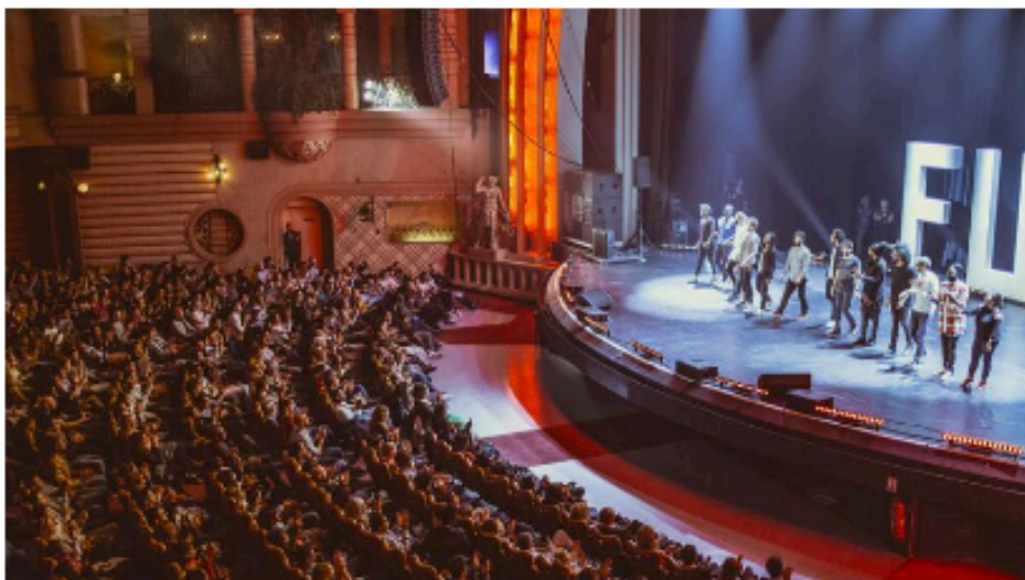
Festival d'humour de Paris.

La 5 e édition du Festival d'humour de Paris fait le plein de nouveautés. En plus des 400 artistes (dont François-Xavier Demaison et Bérengère Krief) qui défilent sur différentes scènes de la capitale, l'événement propose des soirées stand-up ainsi que trois jours dédiés à l'humour digital.