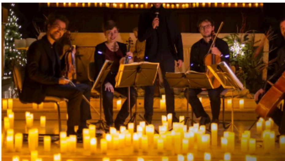
Le Quatuor Hanson joue Beethoven. Candlelight France

En plein cœur du Quartier latin, la Maison des océans accueille un concert unique de musique classique. Dans un décor emprunt d'une grande poésie, le Quatuor Hanson joue Beethoven à la lueur des bougies. Une expérience intime et réconfortante.