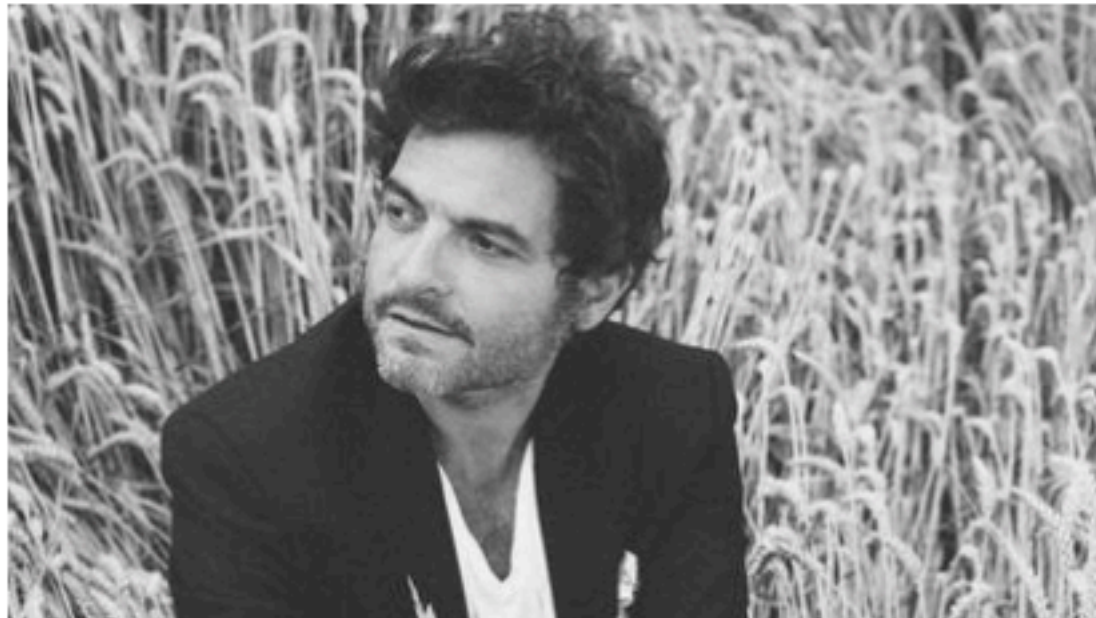
Le chanteur Matthieu Chedid assure le show.

Publié hier à 15:40, mis à jour hier à 15:41