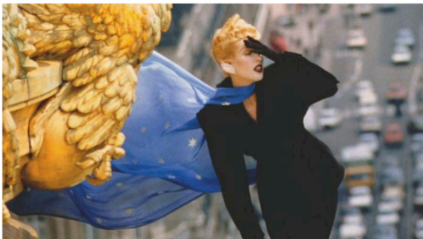
Manfred Thierry Mugler à Bercy Village. Manfred Thierry Mugler, Courtesy Polka Galerie

Après une première exposition à la Galerie Polka, le grand couturier et photographe Manfred Thierry Mugler (qui a fait modifier son prénom), revient présenter ses clichés dans les passages de Bercy Village. Au total, 34 photographies, mettant en scène des beautés flamboyantes dans des univers oniriques.